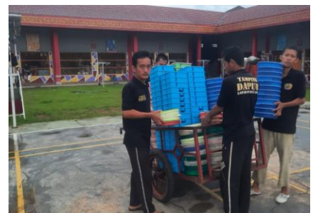
DISTRIBUSI MAKAN WBP