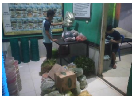
PENERIMAAN BAHAN MAKANAN