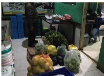
PENERIMAAN BAHAN MAKANAN