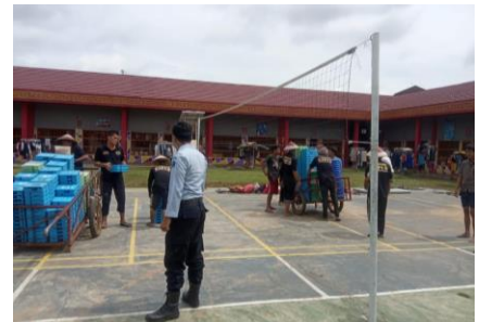
DISTRIBUSI MAKAN WBP