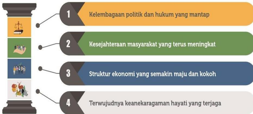
Gambar. Empat Pilar RPJMN IV tahun 2020 - 2024

Rencana Pembangunan Jangka Menengah Nasional (RPJMN) 2020-2024 merupakan tahapan terakhir dari Rencana Pembangunan Jangka Panjang Nasional (RPJPN) 2005-2025. Terdapat 4 (empat) pilar dari RPJMN 2020-2024 untuk mencapai tujuan utama dari rencana pembangunan nasional periode terakhir, yaitu: